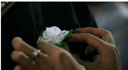
Hình 5. Cài hoa hồng trắng là đã mất mẹ [34].

Cuối cùng, đại chúng nghe bài hát bông hồng cài áo, ai còn cha mẹ được cắm bông hồng đỏ thì trong lòng rất vui và tự hào, ai mất cha mẹ thì mang theo bông hồng trắng, vô cùng xúc động và đau xót (tích cực), cảm thấy mình đã đánh mất một kho tàng quý giá. Đồng thời, nghi lễ này cũng là một tập tục, tập làm người con hiếu thảo, tập làm chủ. Kể từ khi thầy Thích Nhất Hạnh viết bài “Bông hồng cài áo”, nội dung của nó đã được áp dụng vào các nghi lễ của lễ Vu Lan, nghi lễ cài hoa hồng đã trở thành một nghi lễ không thể thiếu trong lễ Vu Lan, không chỉ khiến nội dung lễ hội càng thêm phong phú, ý nghĩa, có giá trị, đồng thời làm cho sự nghiệp truyền bá đạo Phật ngày càng cao, thấm sâu vào quần chúng, làm cho khoảng cách giữa đạo Phật với nhân dân ngày càng được rút ngắn lại, nhận thức về đạo Phật ngày càng nâng cao. Xét từ những việc làm, nội dung, nghi lễ... thì lễ cài hoa hồng có ý nghĩa và giá trị đáng kinh ngạc. Vì vậy, trong quá trình phát huy đạo hiếu thông qua lễ Vu Lan, cộng đồng Phật tử Việt Nam đã không ngừng cập nhật và quảng bá. Nghi lễ này được đông đảo đồng bào Việt Nam trên khắp cả nước và nước ngoài sử dụng. Đồng thời, Phật giáo đã hình thành nên nét đặc sắc của văn hóa truyền thống nước nhà, làm cho văn hóa Việt Nam ngày càng phong phú và tươi sáng hơn.