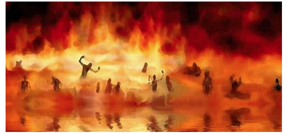
Hình 1. Địa ngục [16].

người này sẽ bị đọa xuống địa ngục, không có tự do, chịu nhiều đau khổ, không thể xóa bỏ được.” [15]