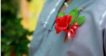
Hình 4. Cài hoa hồng đỏ là còn mẹ [33].

Thầy pháp đã giải thích cho đại chúng về nguồn gốc và giá trị của lễ Vu Lan, lòng nhân từ sâu xa của cha mẹ, con cái nên báo đáp như thế nào và khuyên đại chúng chăm chỉ học Phật pháp, trừ ác và làm việc thiện, v.v. Những ai còn mẹ thì cài hoa hồng đỏ, ai mất mẹ thì cài hoa hồng trắng để chia ly. Công chúng vừa nghe nhạc vừa cài hoa hồng.