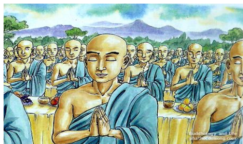
Hình 3. Mục Kiền Liên cứu mẹ [23].

Các văn bản về lịch sử Phật giáo nguyên thủy và đại thừa, đều thông nhất cho rằng: Lễ hội Vu lan khởi nguồn từ điển tích tôn giả Mục Kiền Liên cứu mẹ: Lễ Vu Lan chính thức được bắt nguồn từ một bản kinh ngắn của Phật giáo Đại Thừa "Phật Thuyết Kinh Vu Lan Bồn", do ngài Trúc Pháp Hộ dịch từ tiếng Phạn sang tiếng Hán vào đời Tây Tấn, tức khoảng năm 750-801 sau Công Nguyên. [24]